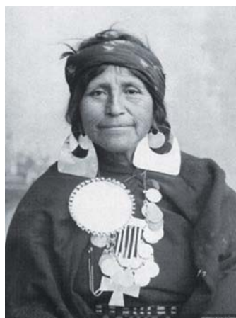
Mapuche-Frau mit Silberschmuck