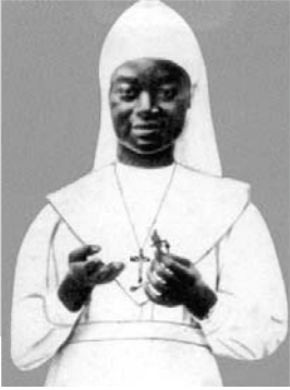
Clementine Anuarite Nengapeta