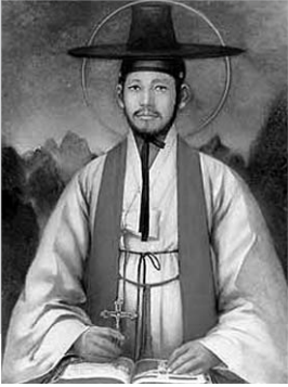
Andreas Kim Tae-gon