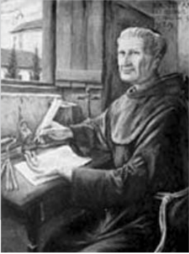
Antônio de Sant'Ana Galvão