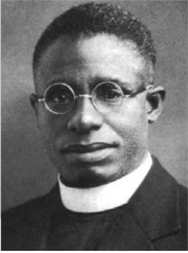
Iwene Michael Cyprian Tansi